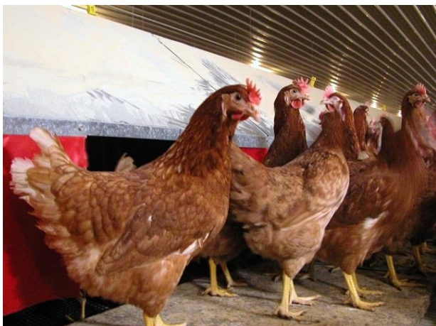
Aves criadas em galpão à frente dos ninhos.