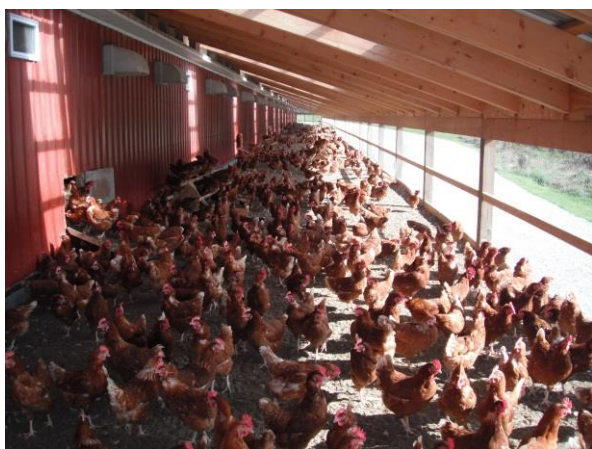
Aves criadas em galpão no jardim de inverno....