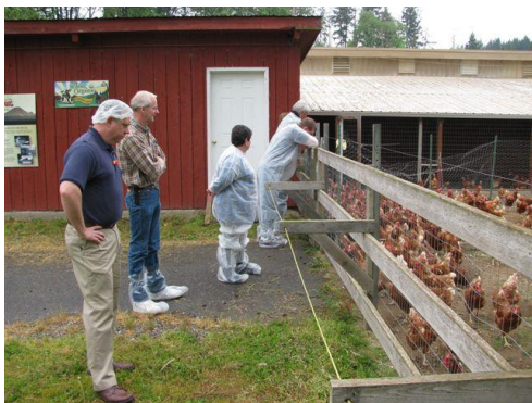
Galinhas no sistema Free-Range : mínimo 0,2m 2 /ave na área externa – o clima permitindo.