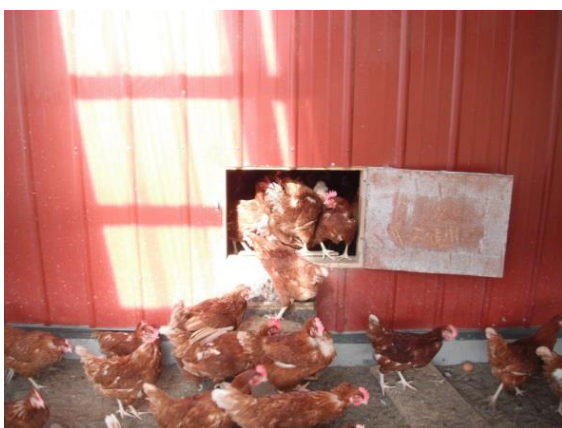
Saída do galpão para o jardim de inverno.