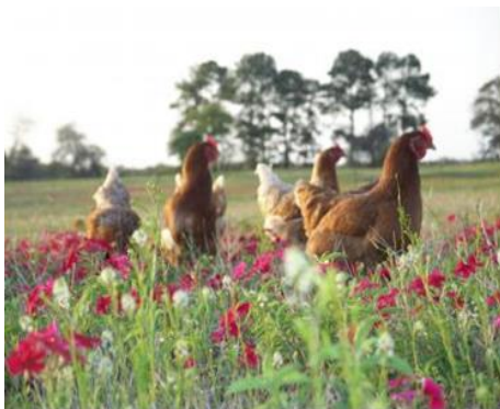
Pastagem: 10m 2 /ave na área externa o ano todo.

As informações contidas neste documento são retiradas do Capítulo 22, “Canibalismo”, por R.C. Newberry em “Welfare of the Laying Hen” (Ed. G.C. Perry), publicado por CAB International 2004. A versão completa deste capítulo em PDF, incluindo todas as referências científicas dos estudos mencionados, está disponível aos produtores por solicitação.