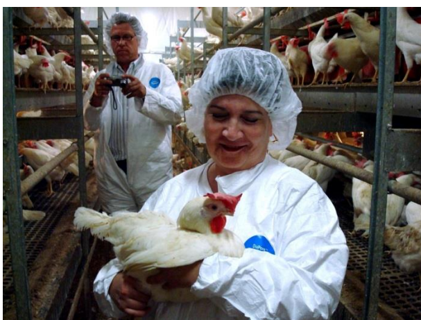
Sistema de aviário – criação em galpão.