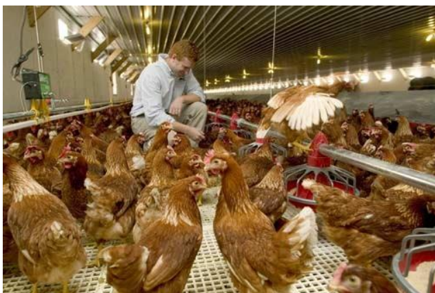
Galpão de criação Cage-free : 0,14m 2 /ave.